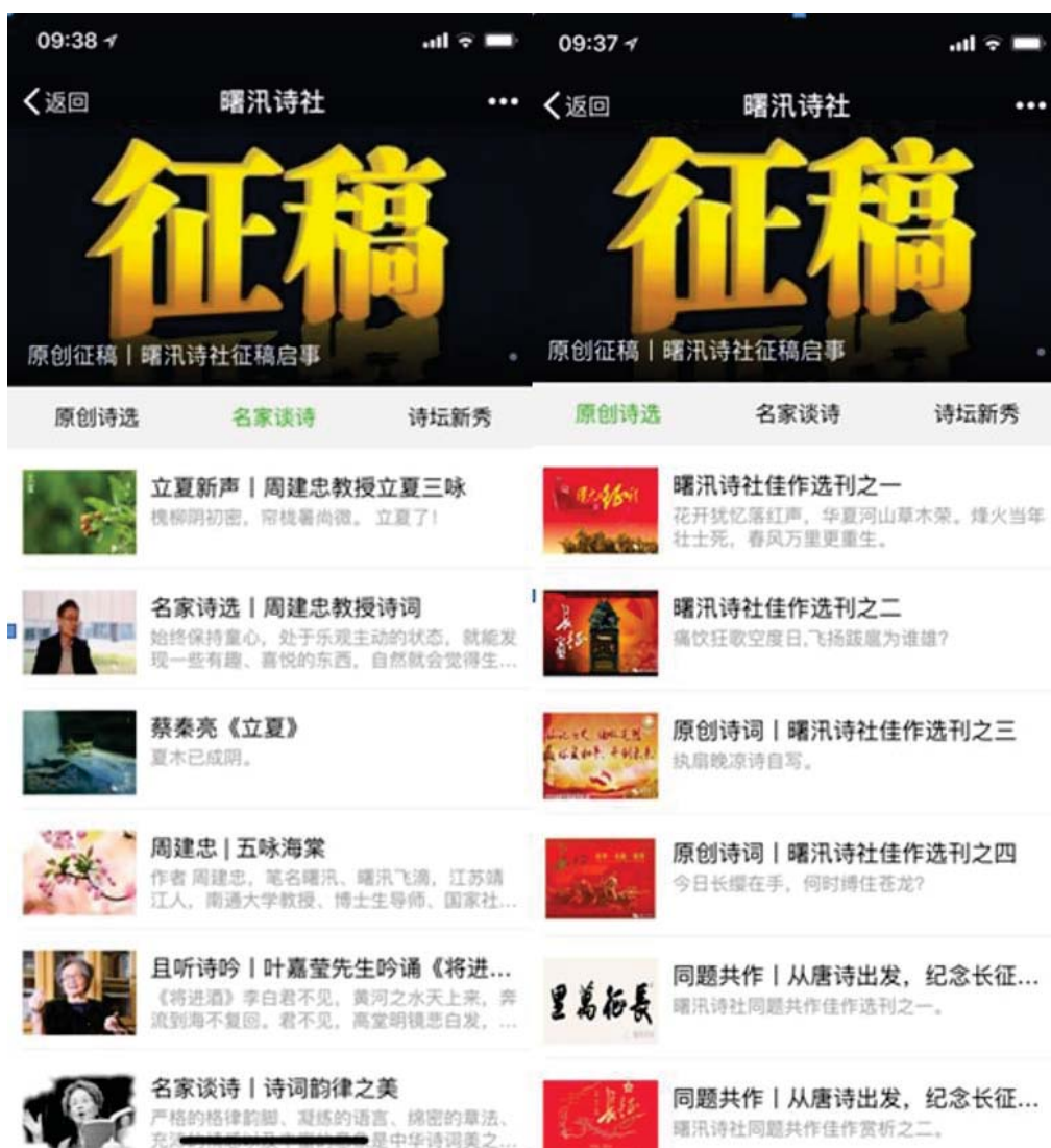
诗社微信公众号截图