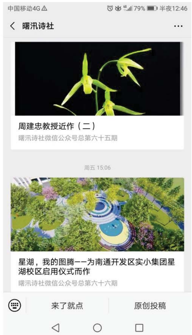
改版后诗社微信公众号截图